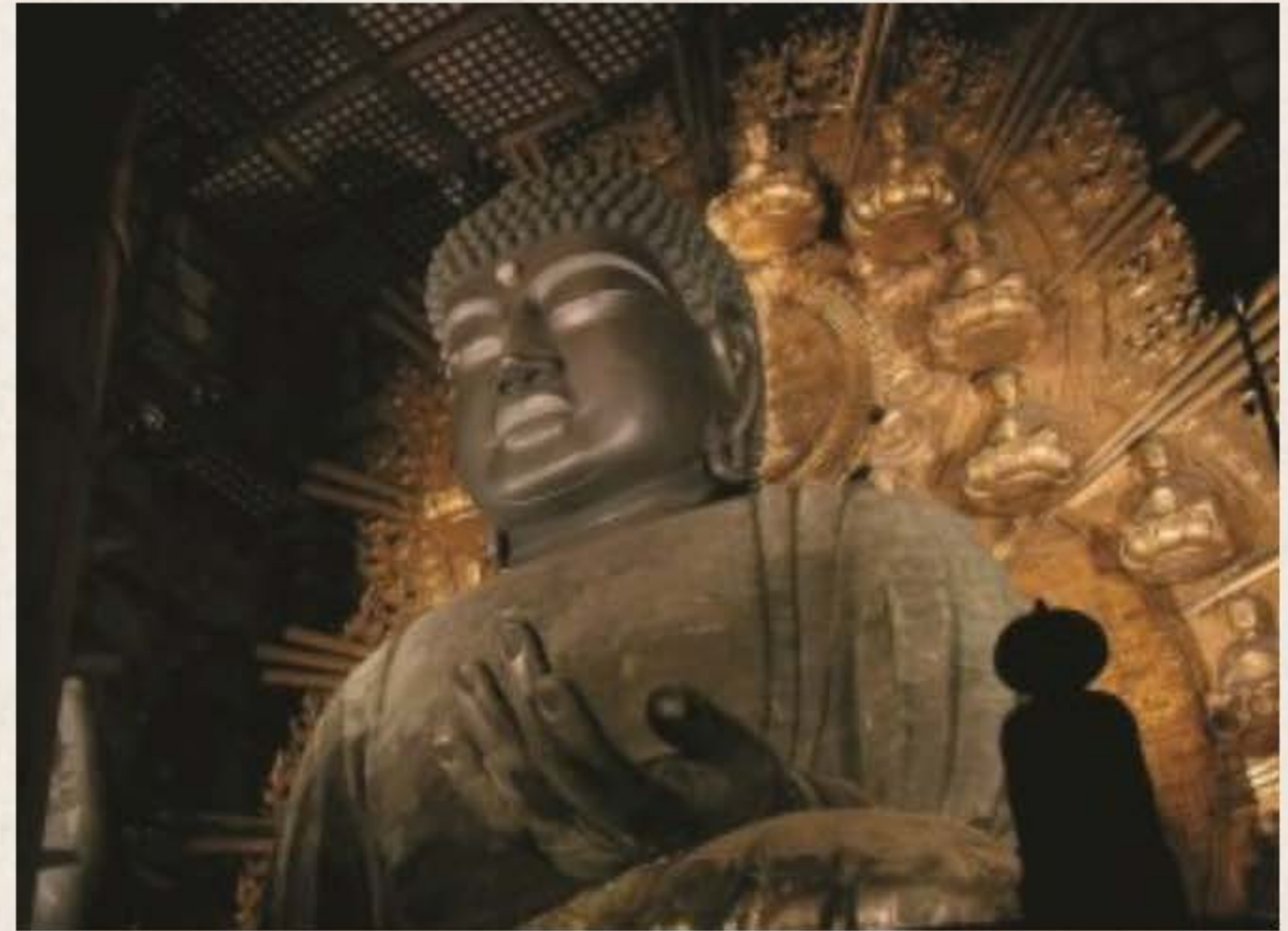
도다이지 대불전에 있는 여사나불(盧舍那佛)