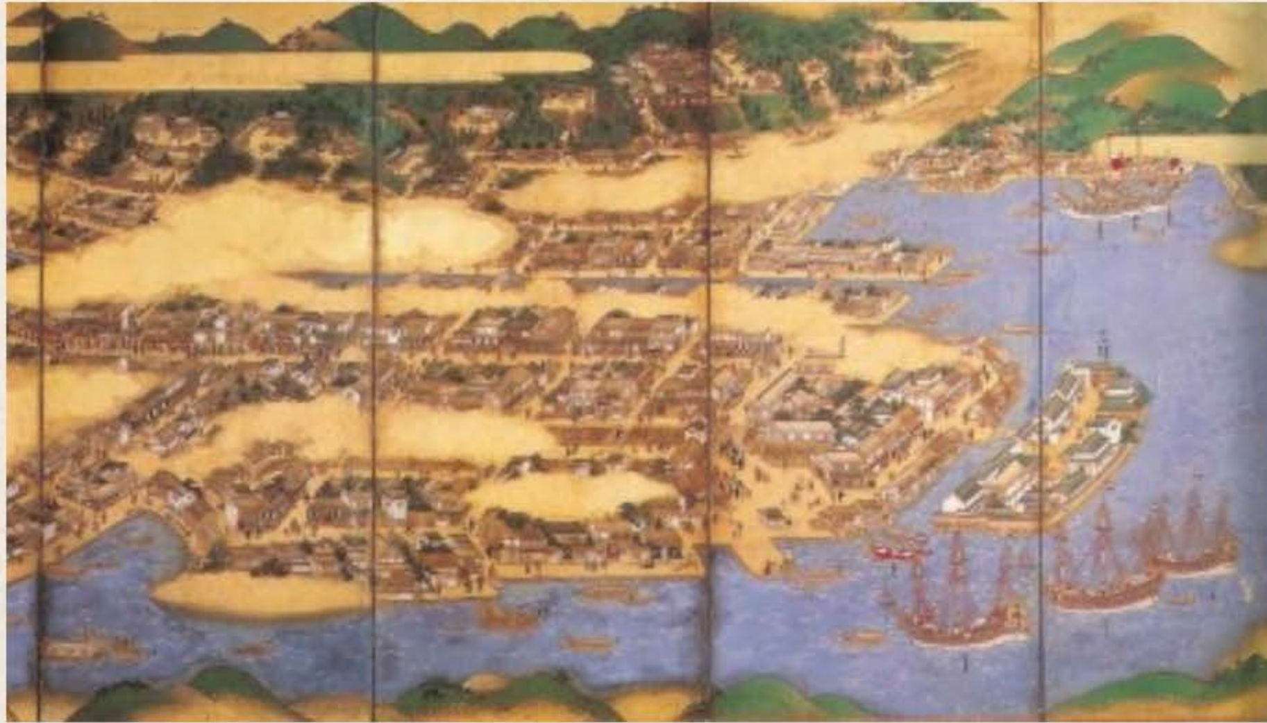
에도시대의 나가사키(長崎)를 그린 병풍.

4개의 창구는 나가사키(長崎, ながさき), 쓰시마번(対馬藩, つしまはん), 사쓰마번(薩摩藩, さつまはん), 마쓰마에번(松前藩, まつまえはん)