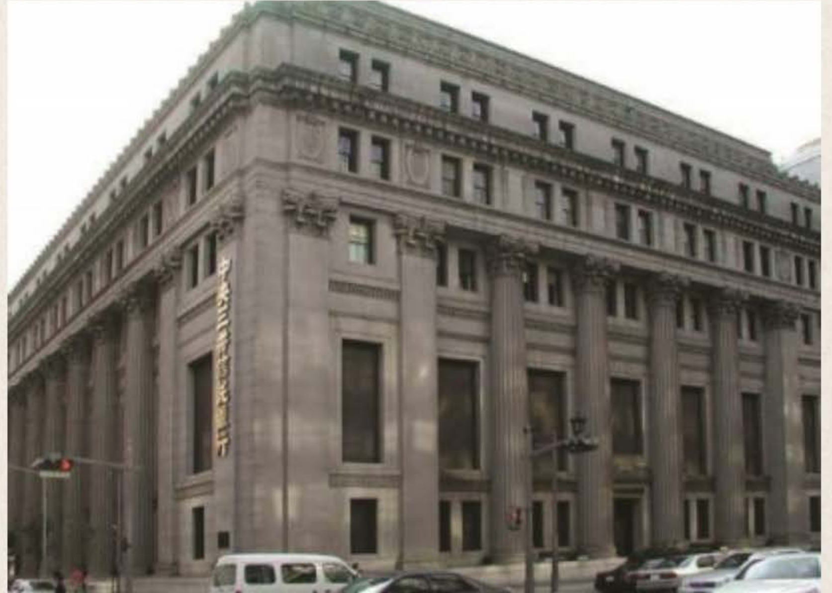
미쓰이 재벌의 본거지인 미쓰이 본관.