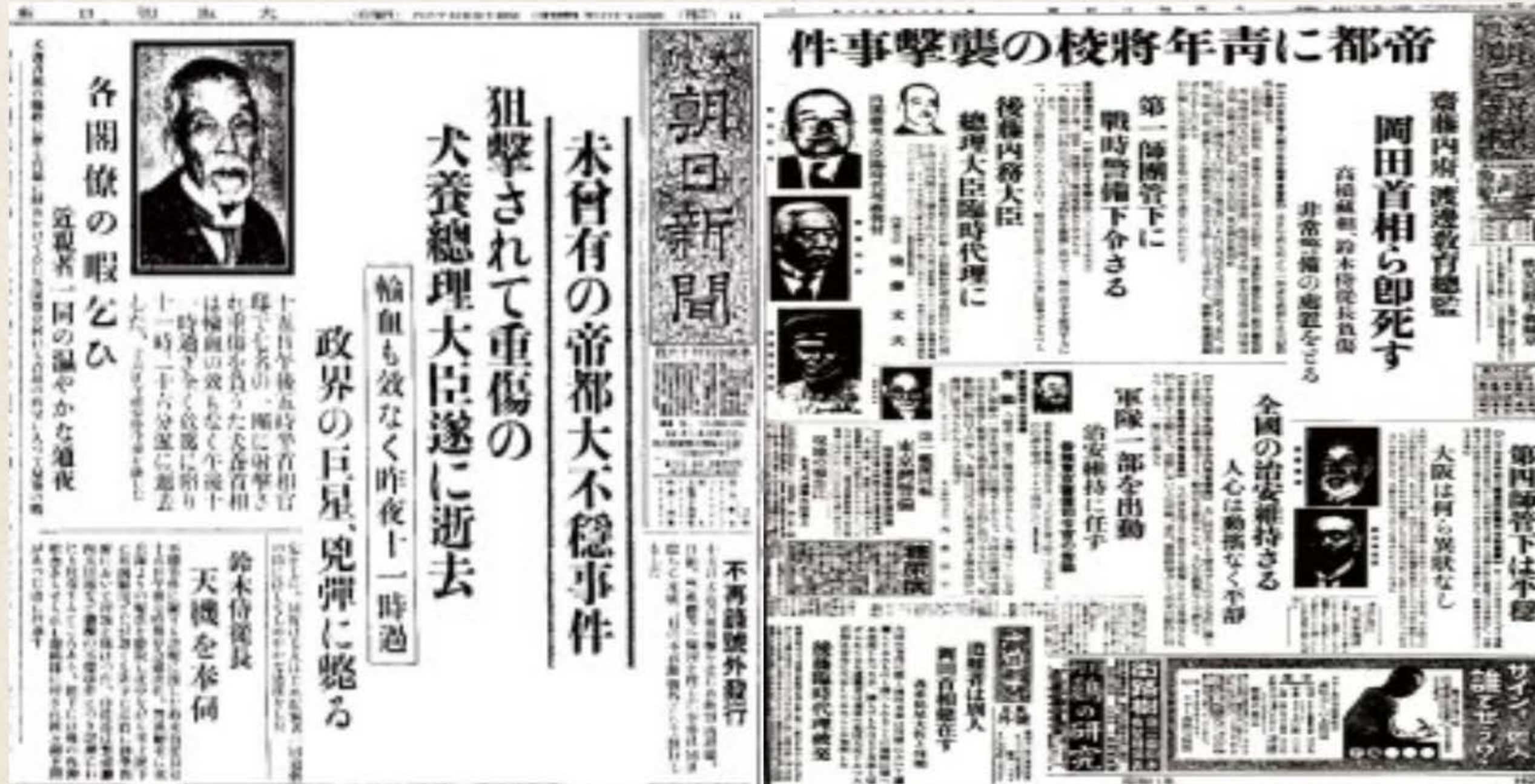
5.15사건이 실린 신문 기사