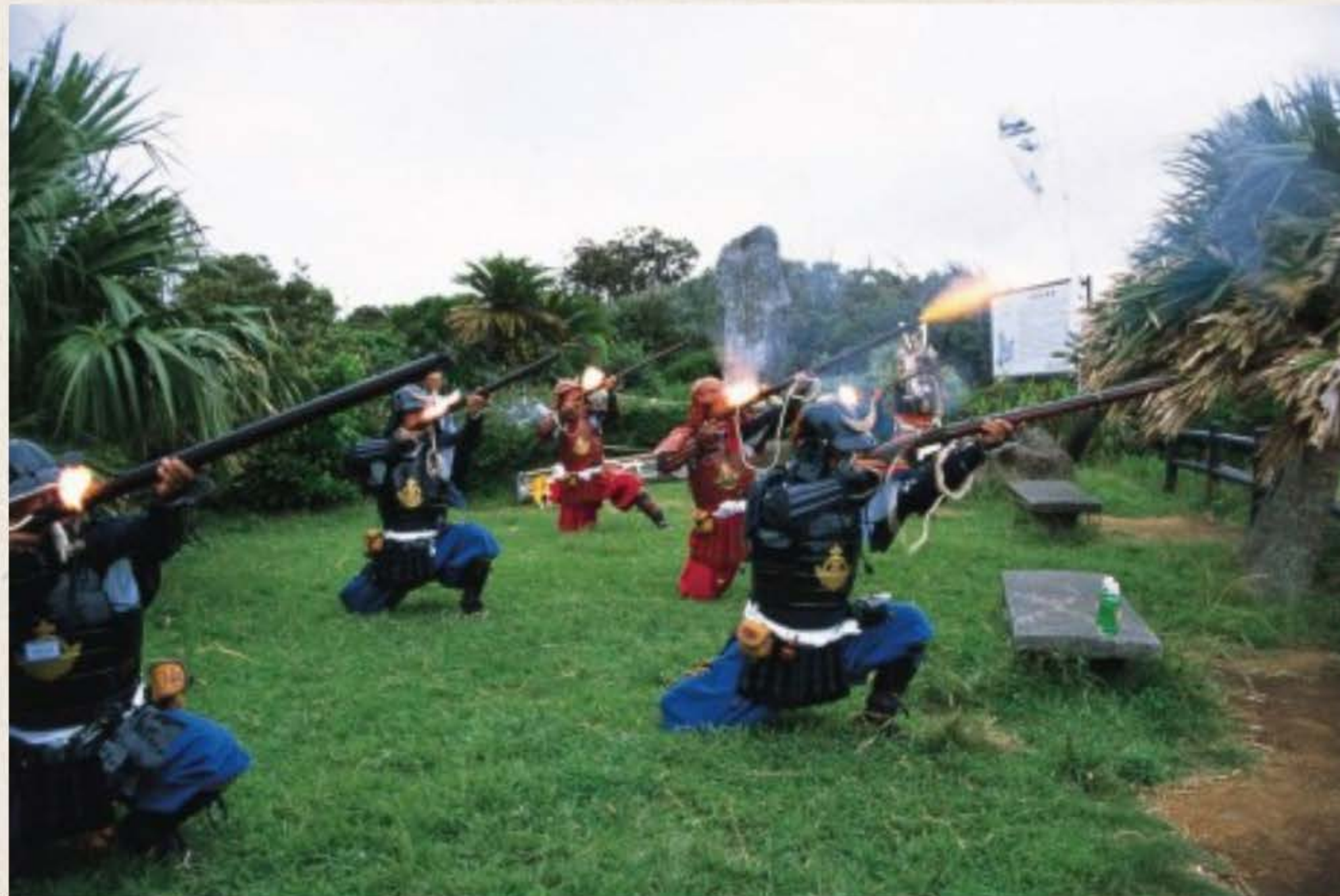
다네가시마 총(種子島銃)의 발사 모습.