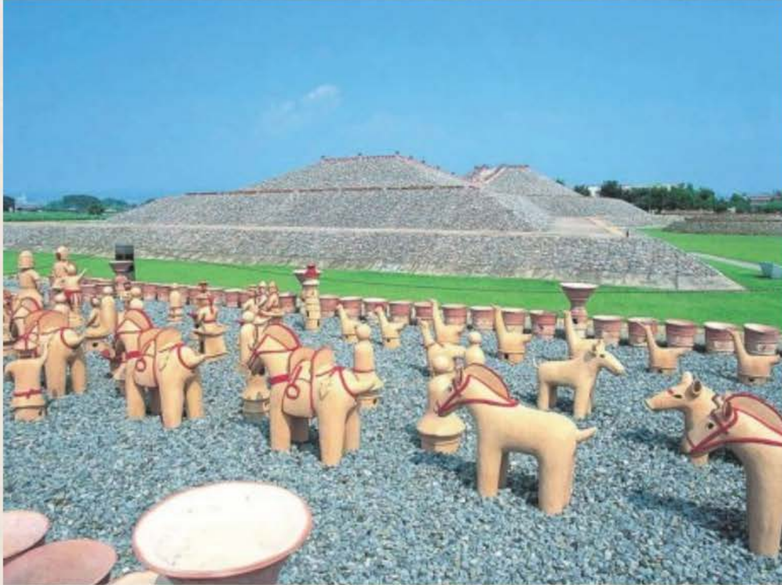
호토다하치만즈카 고분(保渡田八幡塚古墳)과 토용(土俑)